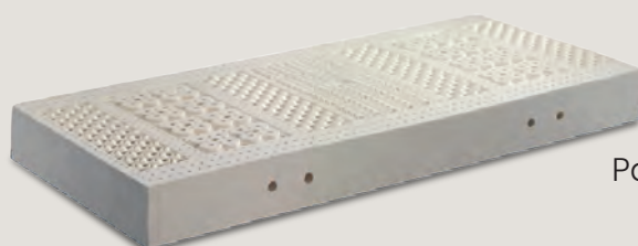
Núcleo Pastilla de látex.